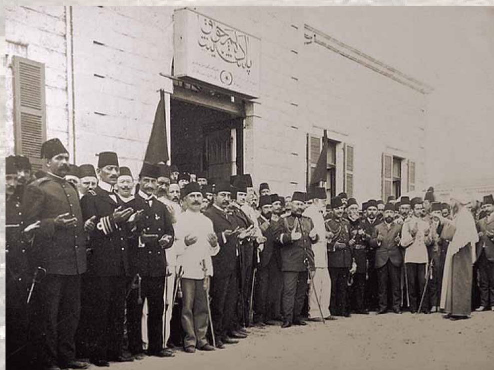
תפילה בעת פתיחת תחנת הרכבת של חיפה 1905