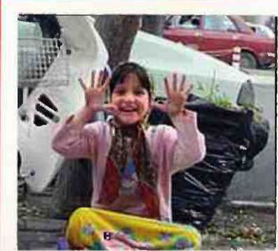
↓ די לקיצוניות

"קשישים וילדים קטנים נאלצים למכור ברכבת התחתית בסקוויטים, גרביים ועטים כדי להתקיים. כיצד העם האומלל הזה, שאינו מצליח לסיים את החודש, יכול לרצות את השמדתה של ישראל?"