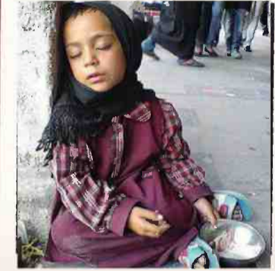
↓ לאן הולך הכסף

"ילד קטן, עוד לא בן עשר, מסתובב ברחובות בבוקר כדי להתפרנס. אינני יכול שלא לחשוב מה היה קורה אילו היו משקיעים את הכסף הרב שבזבז על ההפגנות נגד ישראל בחינוך ובלמודים של הילדים"