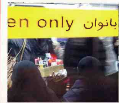
↓ רק רוצים לחיות

"ילד קטן, עוד לא בן עשר, מסתובב ברחובות בבוקר כדי להתפרנס. אינני יכול שלא לחשוב מה היה קורה אילו היו משקיעים את הכסף הרב שבזבז על ההפגנות נגד ישראל בחינוך ובלמודים של הילדים"