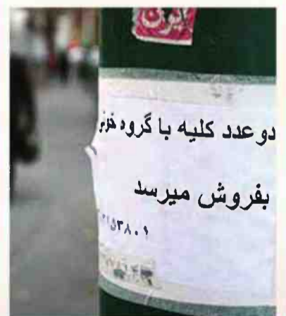
↓ טילים על חשבוננו

"הזוג מביע את חיבתו בפארק כי המחשלה משקיעה במקום אחר. 250 מיליון הדולר שאיראן מעבירה מדי שנה לקבוצות פלסטיניות ולבנוניות קיצוניות יכולים היו לסייע לצעירים איראנים להינשא"