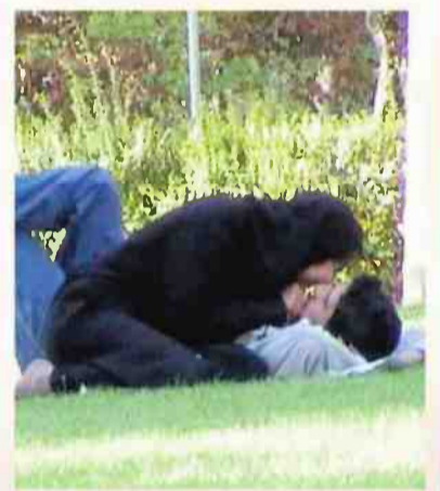
↓ אהבה בפארק לאלה

"הזוג מביע את חיבתו בפארק כי המחשלה משקיעה במקום אחר. 250 מיליון הדולר שאיראן מעבירה מדי שנה לקבוצות פלסטיניות ולבנוניות קיצוניות יכולים היו לסייע לצעירים איראנים להינשא"