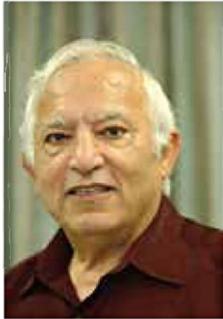
נאום מציון. מנשה אמיר

אני מכיר ידידים בארה"ב שמקיימים קשר רציף עם מקורות בטהרן ובעוד מקומות והם מסכימים שהמשטר נמצא בנקודת שפל. יש הרבה מאוד הפגנות שלא מסוקרות על ידי התקשורת המערבית.